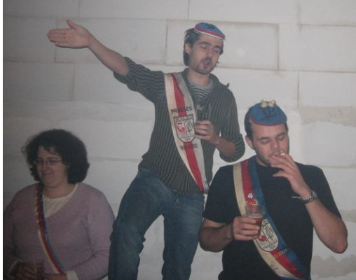
2 foto's van de hilarische oud leden cantus